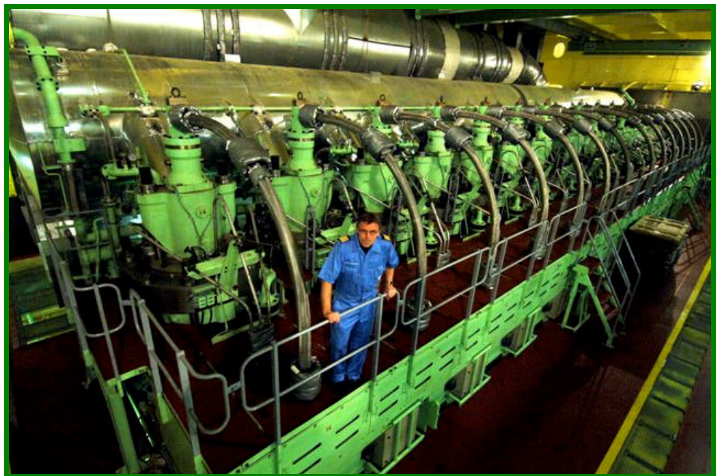
Dernier étage du fameux 14 cylindres