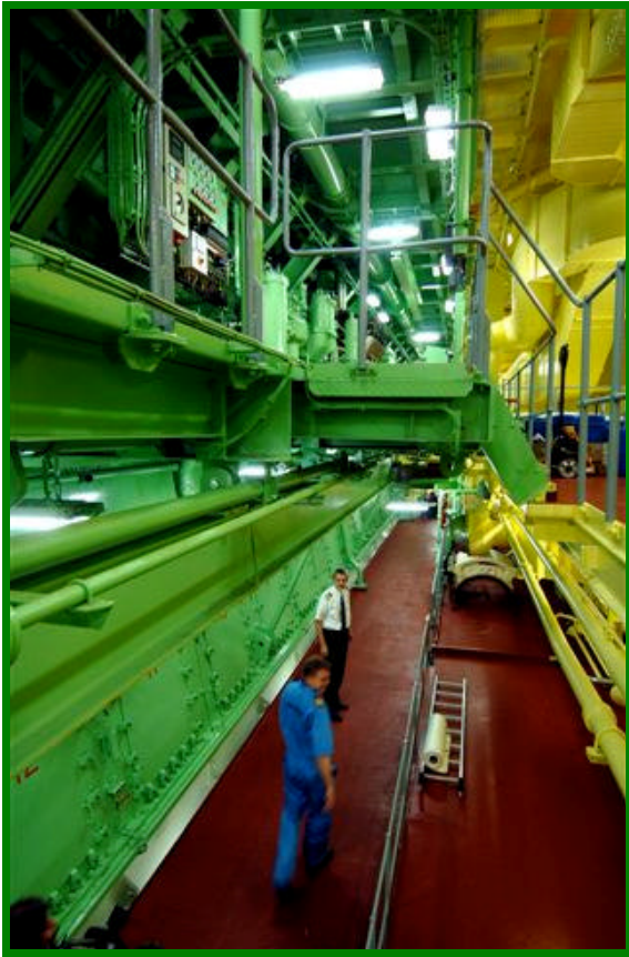
Salle des machines