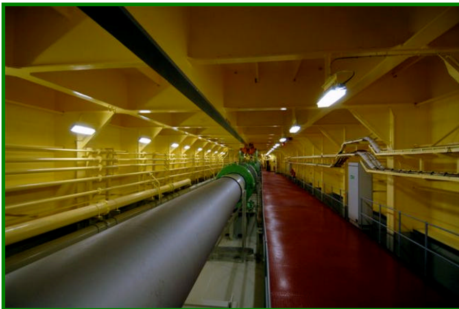
Arbre de transmission